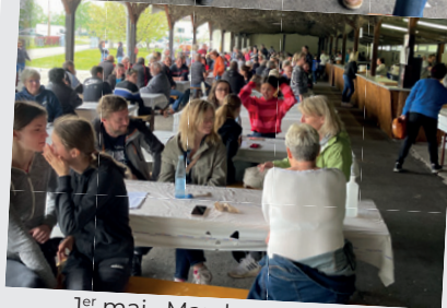
1 er mai • Marche populaire