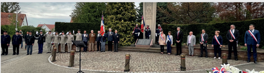
Avec la participation de l'autorité militaire, des anciens combattants, des sapeurs-pompiers, des enfants de l'école Laurent Mockers et de la musique municipale Alsatia de Drusenheim.