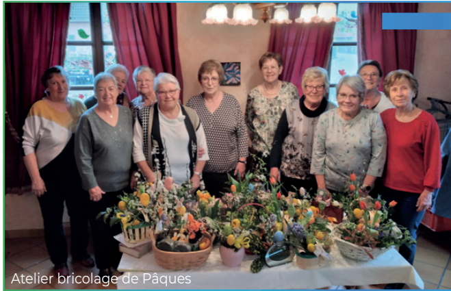
Atelier bricolage de Pâques