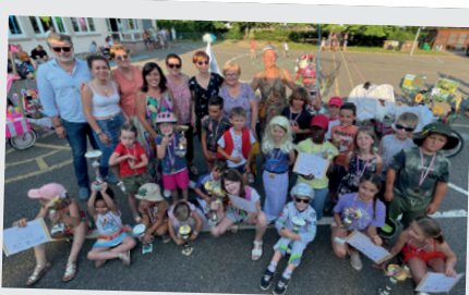
16 juin • Concours vélos décorés à la kermesse de l'école Laurent Mockers